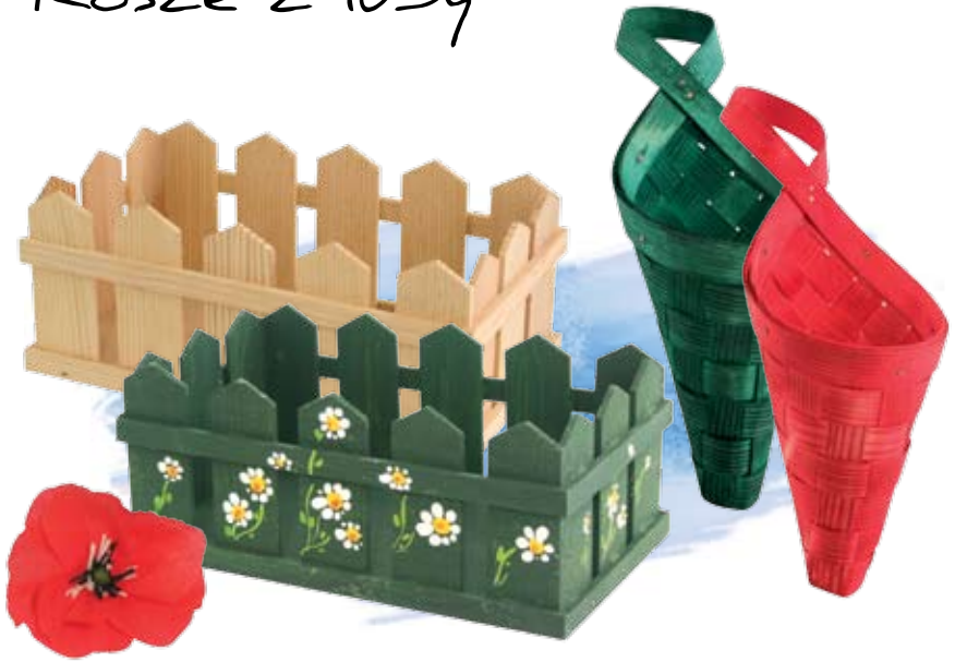
Płotki i kosze na kwiaty suszone lub z bibuły