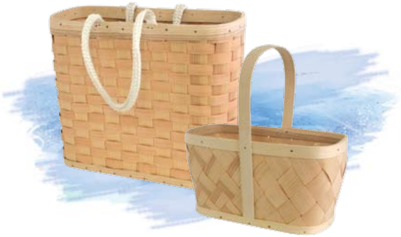
Kosze na zakupy