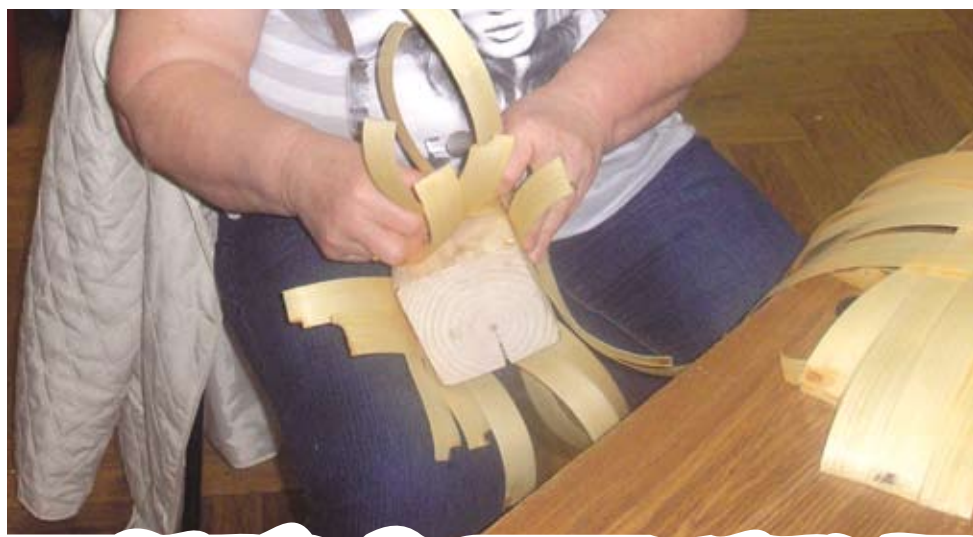
4. Wokół formy zaplatamy koszyk.