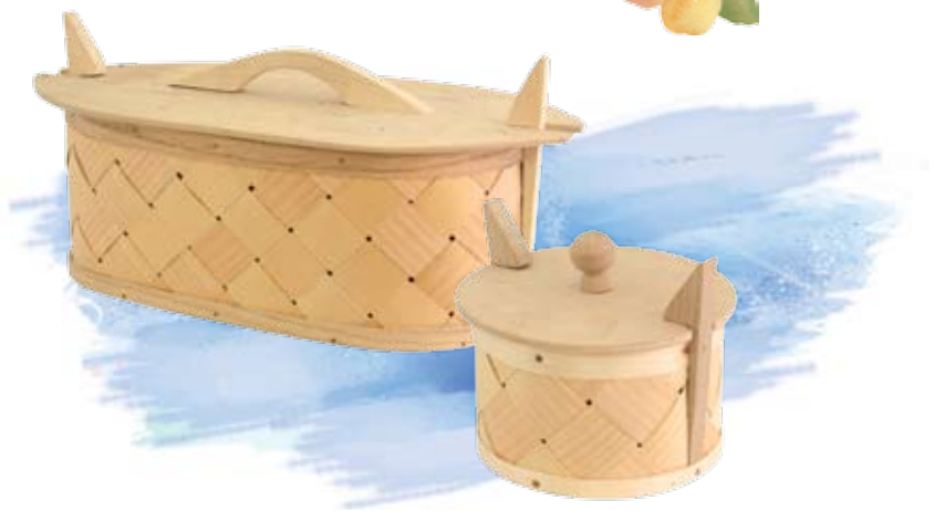
Zamykane pudełka na drobiazgi