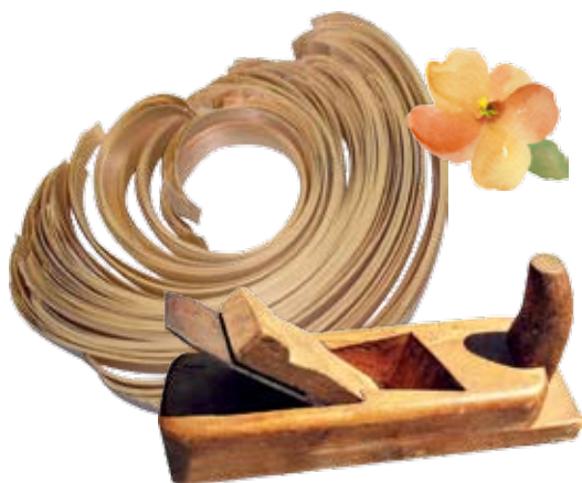
hebel / strug

Z doświadczenia okazało się, że najlepszym materiałem na łubę jest drewno iglaste głównie sosna, która dzięki strukturze jaka posiada po wystruganiu charakteryzują się dużą elastycznością co umożliwia wyginanie jej na różne strony i zaplatanie na różne sposoby.