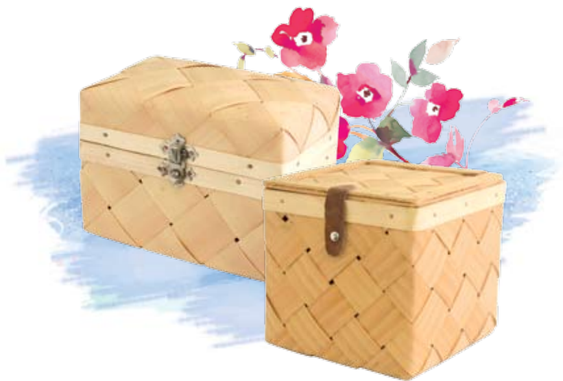
Kuferki na różne skarby