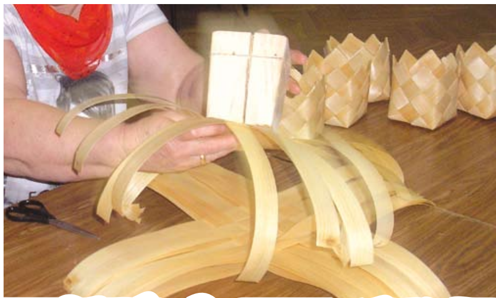
3. Dno przykładamy do formy